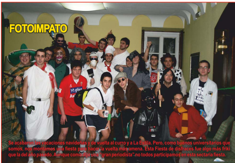
Se acabaron las vacaciones navideñas y de vuelta al curro y a La Estila. Pero, como buenos universitarios que somos, nos montamos una fiesta para hacer la vuelta más amena. Esta Fiesta de disfraces fue algo más friki que la del año pasado. Aunque como una "gran periodista" no todos participamos en esta sectaria fiesta.

Tras una ardua batalla ante nosotros mismo, y tras ver cómo los de licenciatura no daban palo al agua durante un mes, por fin somos libres. Ahora nos toca a nosotros disfrutar de esas pequeñas cosas que nos brinda la vida: una tertulia completa y sin prisas, una noche sin redbulls, una buena siesta...Espero que todos los futuros licenciados tengáis mucha suerte, y a ver si llega algún aprobado en Derecho Romano.