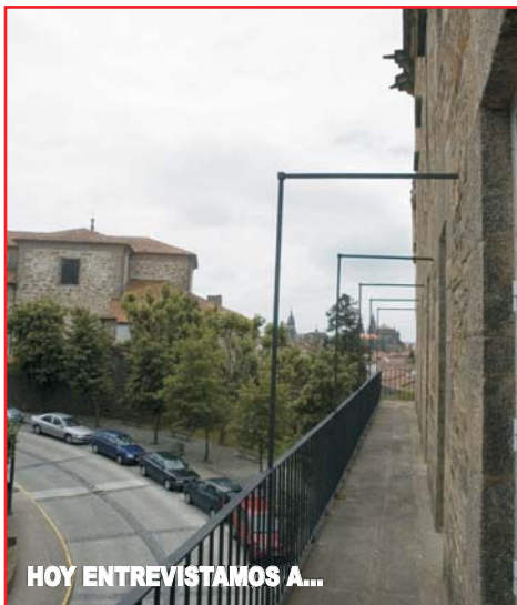
HOY ENTREVISTAMOS A...