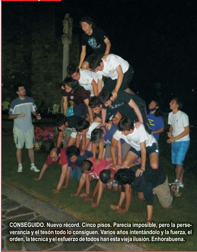
CONSEGUIDO. Nuevo récord. Cinco pisos. Parecía imposible, pero la perseverancia y el tesón todo lo consiguen. Varios años intentándolo y la fuerza, el orden, la técnica y el esfuerzo de todos han esta vieja ilusión. Enhorabuena.